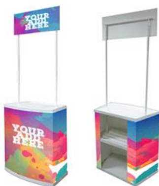
Skica 1. SKICA IDEJNOG RJEŠENJA ŠTANDA

Dimenzije štanda: 80 x 200 x 45 cm (širina x visina x dubina)